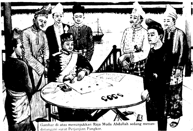
Gambar di atas menunjukkan Raja Muda Abdullah sedang menandatangani surat Perjanjian Pangkor.